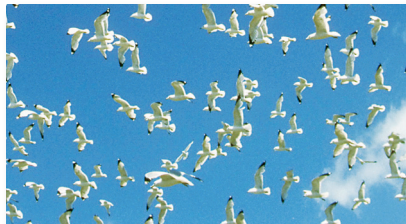
Búsqueda de alimento