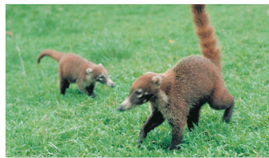
Cuido de las crías